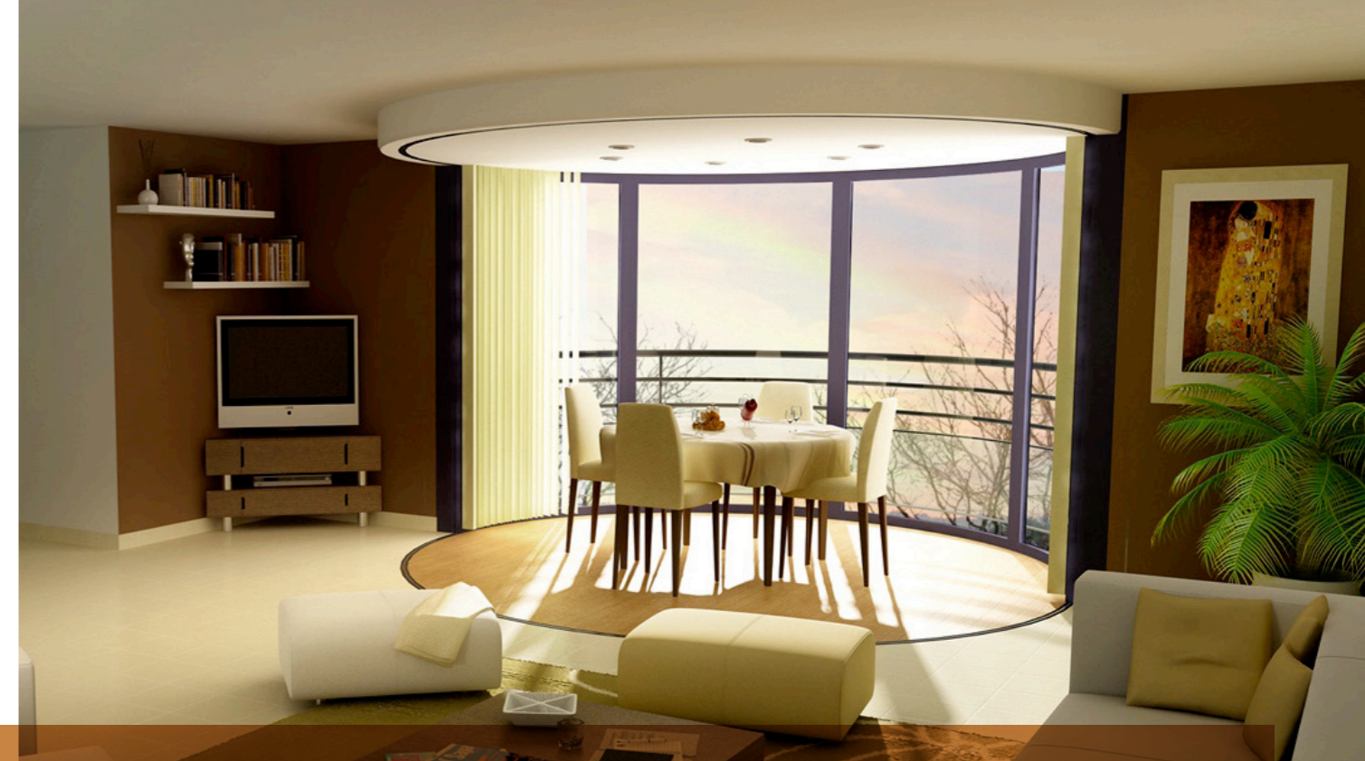
Votre appartement du 3 au 4 pièces.