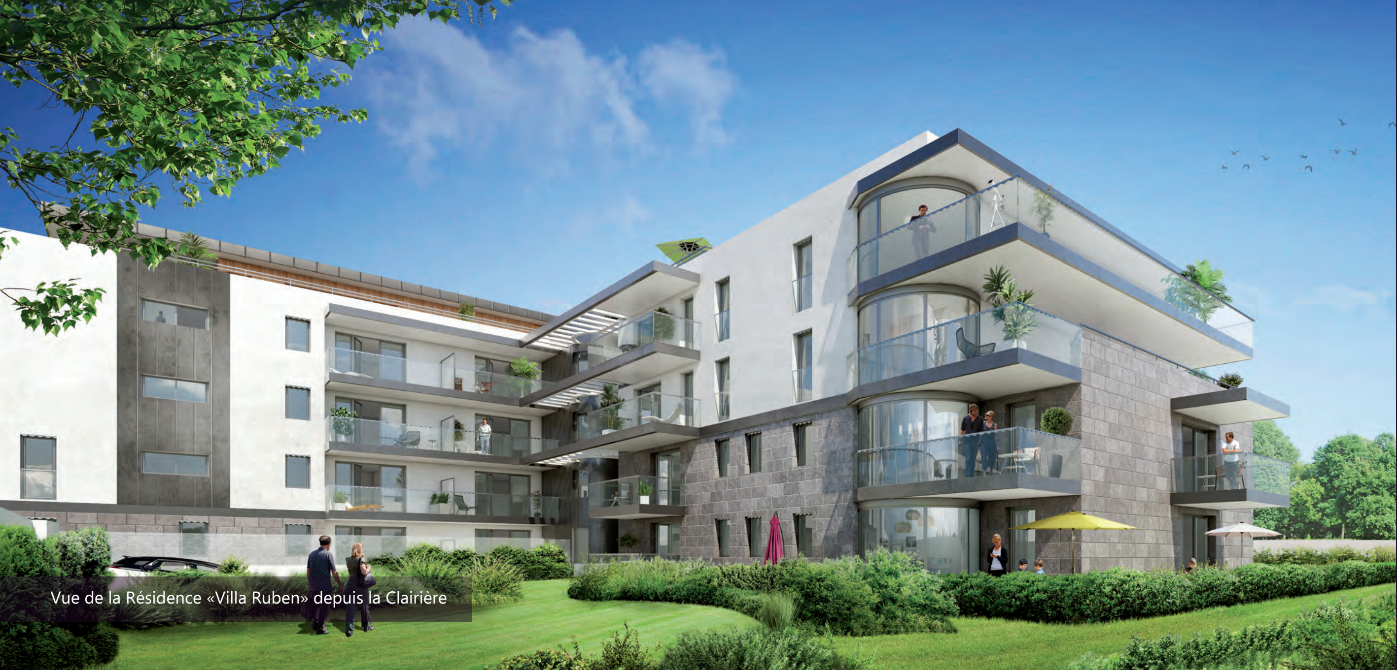
Vue de la Résidence «Villa Ruben» depuis la Clairière