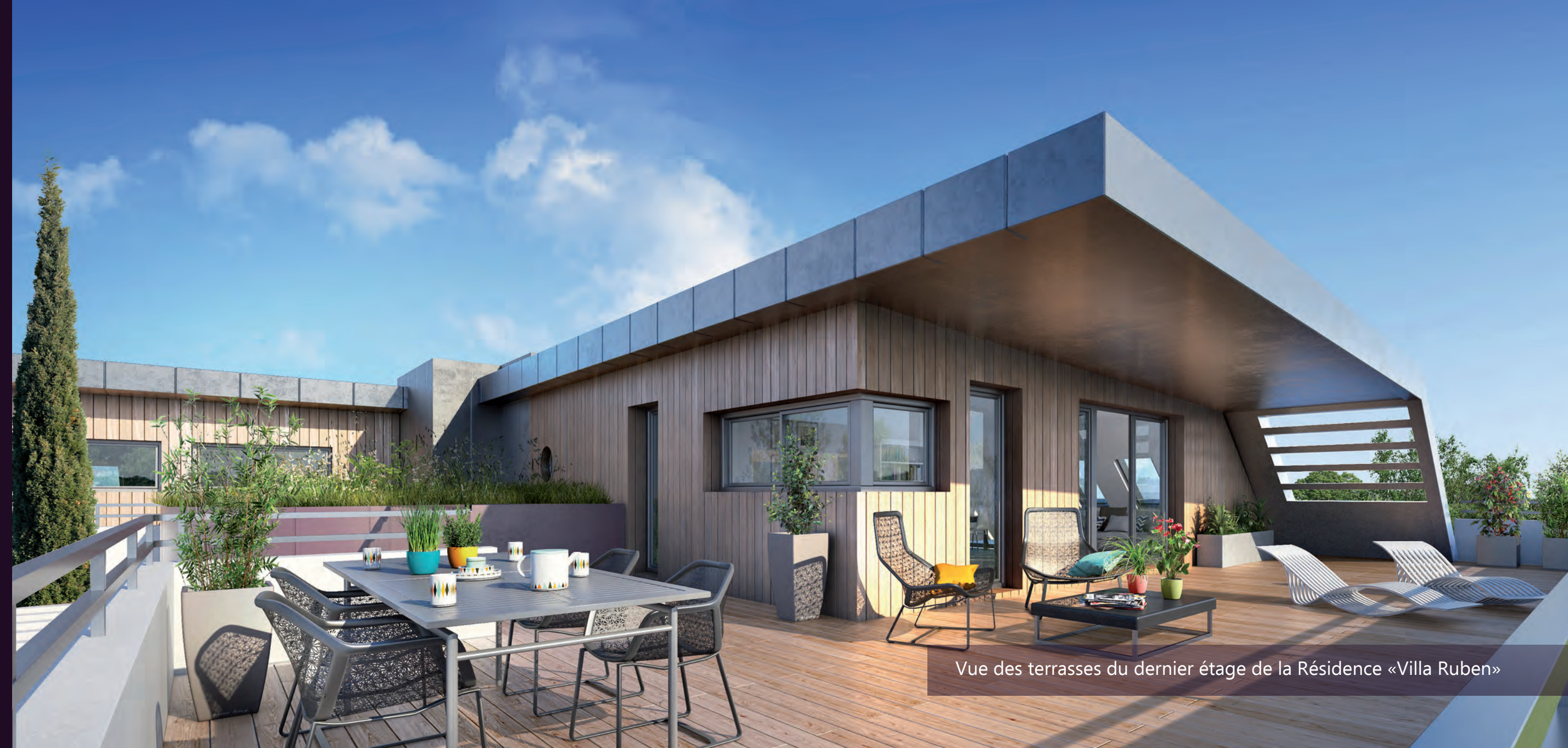
Vue des terrasses du dernier étage de la Résidence «Villa Ruben»