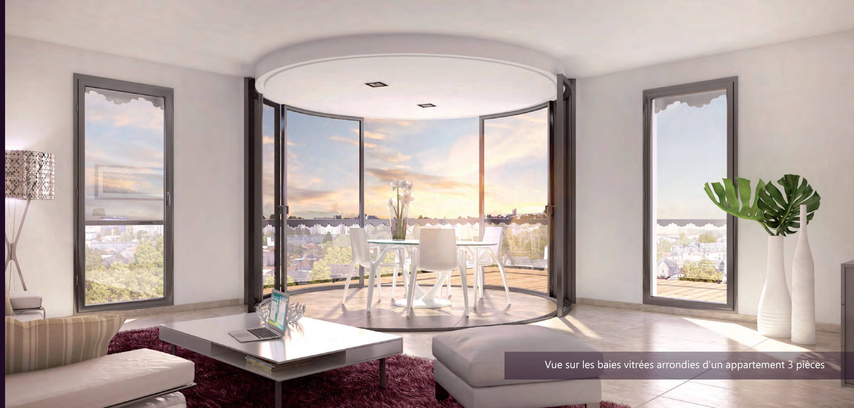
Vue sur les baies vitrées arrondies d'un appartement 3 pièces

Ni «bow-window», ni véranda ! Ce concept novateur réinvente la transition de l'espace intérieur/extérieur et révolutionne la menuiserie traditionnelle. Ces baies vitrées arrondies coulissent à 360° sur un rail et s'adaptent aux besoins des occupants au gré des saisons. Elles optimisent les apports solaires afin de maintenir un confort optimum et offrent en toutes saisons une vue panoramique. Elles procurent au logement une valeur ajoutée et une architecture résolument moderne.