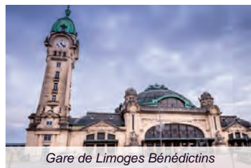
Gare de Limoges Bénédictins