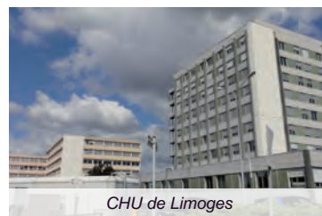
CHU de Limoges