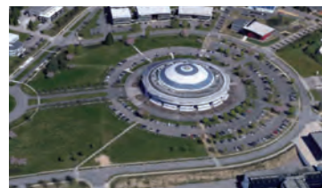
Zone Ester Technopole